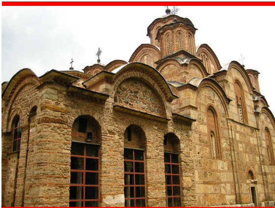
Monastère Gracanica, Kosovo