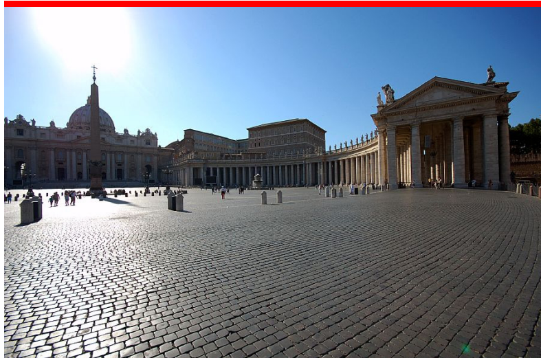
Cité du Vatican © Tous droits réservés

Couverture: Mosquée Lala Mustafa Pacha (ancienne Cathédrale Saint-Nicolas), Chypre. © Tous droits réservés