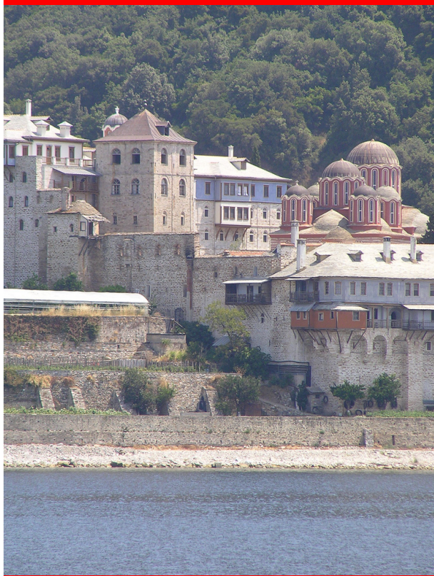
Mont Athos (Monastère Xénophon)