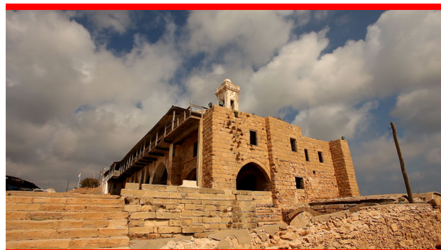
Monastère Apostolos Andreas, Chypre

Chaque site sacré est différent en termes de typologie, de taille, d'histoire et de droit. Une telle diversité est un atout, car elle offre un large éventail de modèles et d'expériences qui peuvent être utiles à la préparation d'un cadre de protection pour les lieux sacrés.